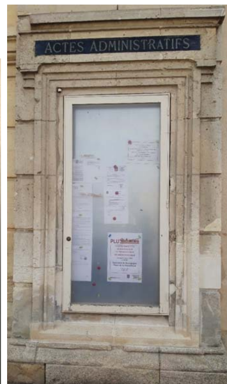
Extrait de l'affichage réalisé avant la réunion publique (devant la mairie de Bourgogne)