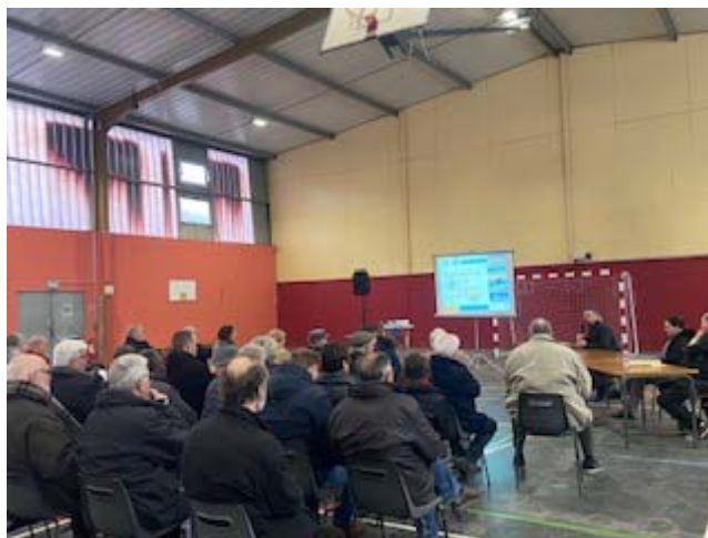
Photo prise lors de la réunion publique

Cette réunion publique a rassemblé 40 personnes environ. Le compte rendu de cette réunion est annexé au présent bilan.