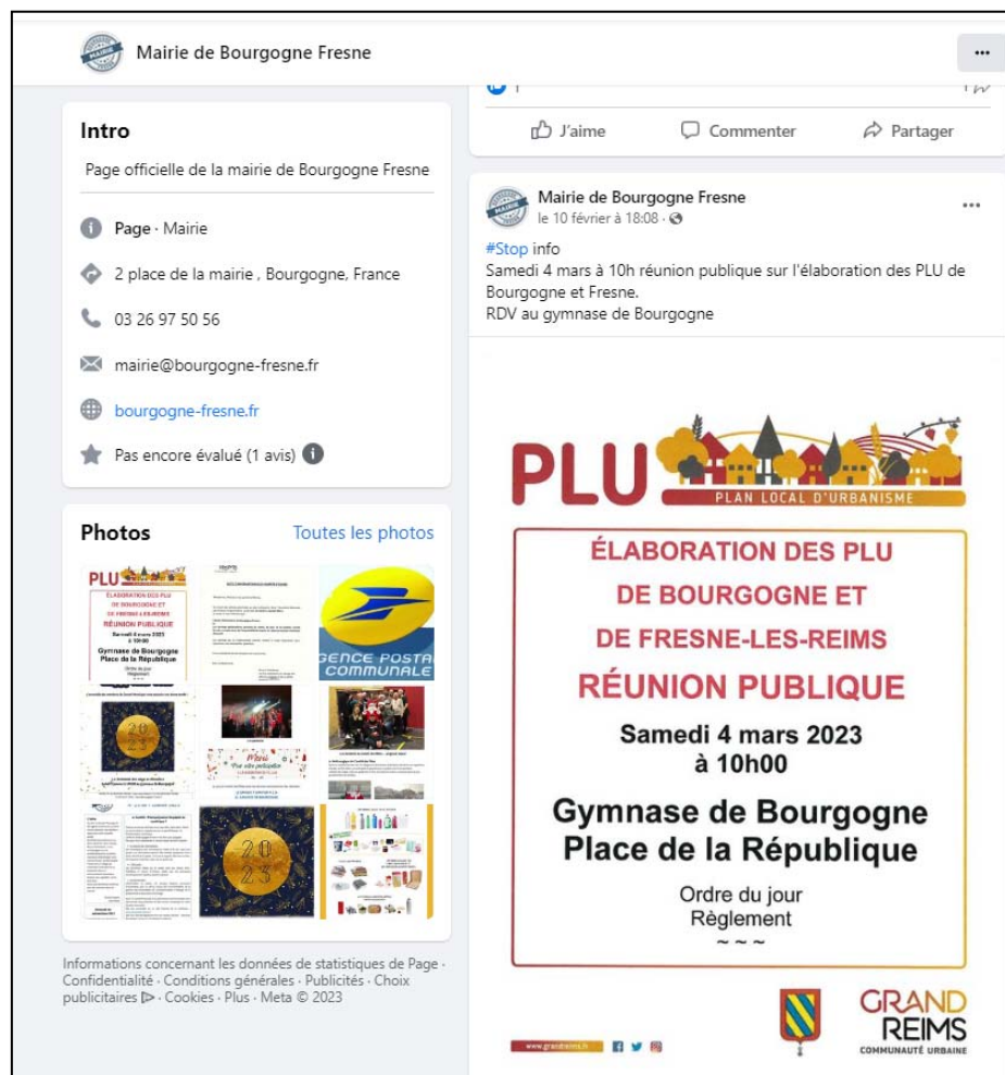
Extrait compte facebook de la commune à la date du 04/03/23