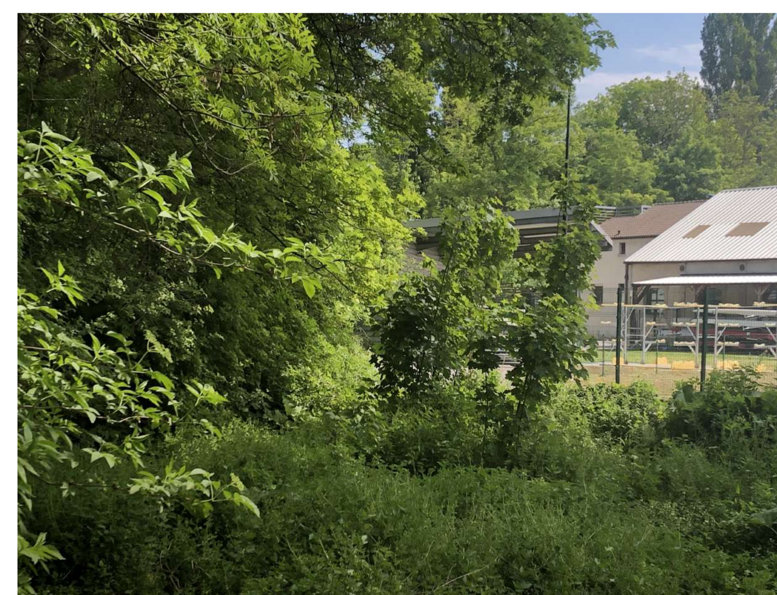
Photos du site d'étude et de ses abords