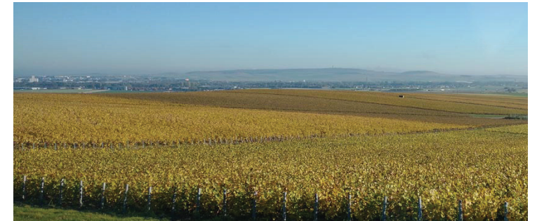
Vue depuis le Mont Thibé

Enfin, les futures opérations de développement urbain doivent s'insérer dans le paysage taissotin en respectant les caractéristiques urbaines et architecturales communales. Par exemple, afin d'assurer un cadre de vie agréable aux habitants, une insertion paysagère doit être réalisée au droit du développement urbain au Sud du bourg notamment vis-à-vis de l'autoroute A4.